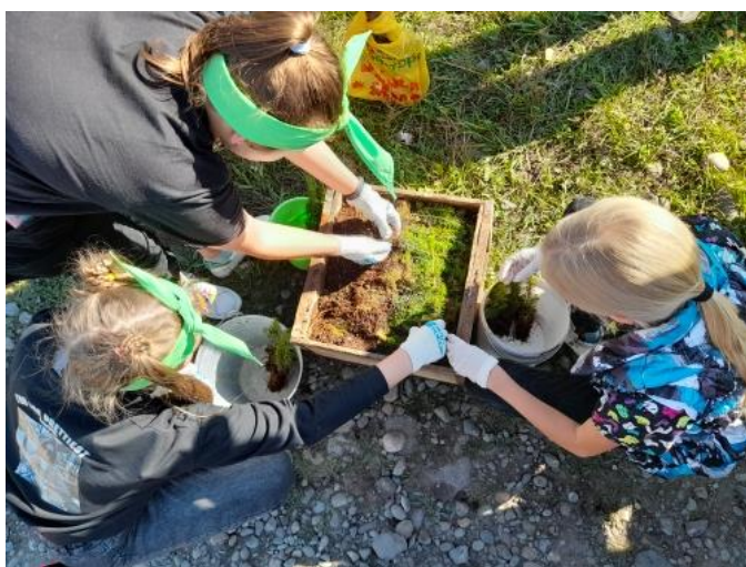
Целый ящик саженцев ели